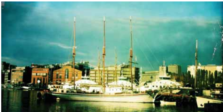
Mohawk til kai.