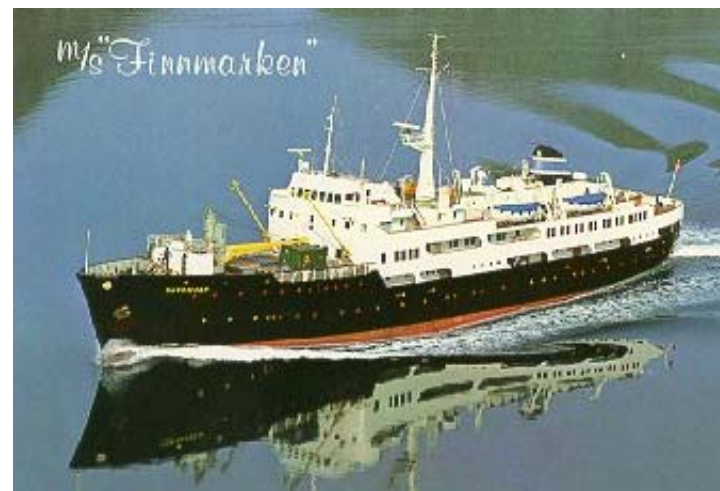
Den gamle Finnmarken som nå er på hurtigrutemuseet